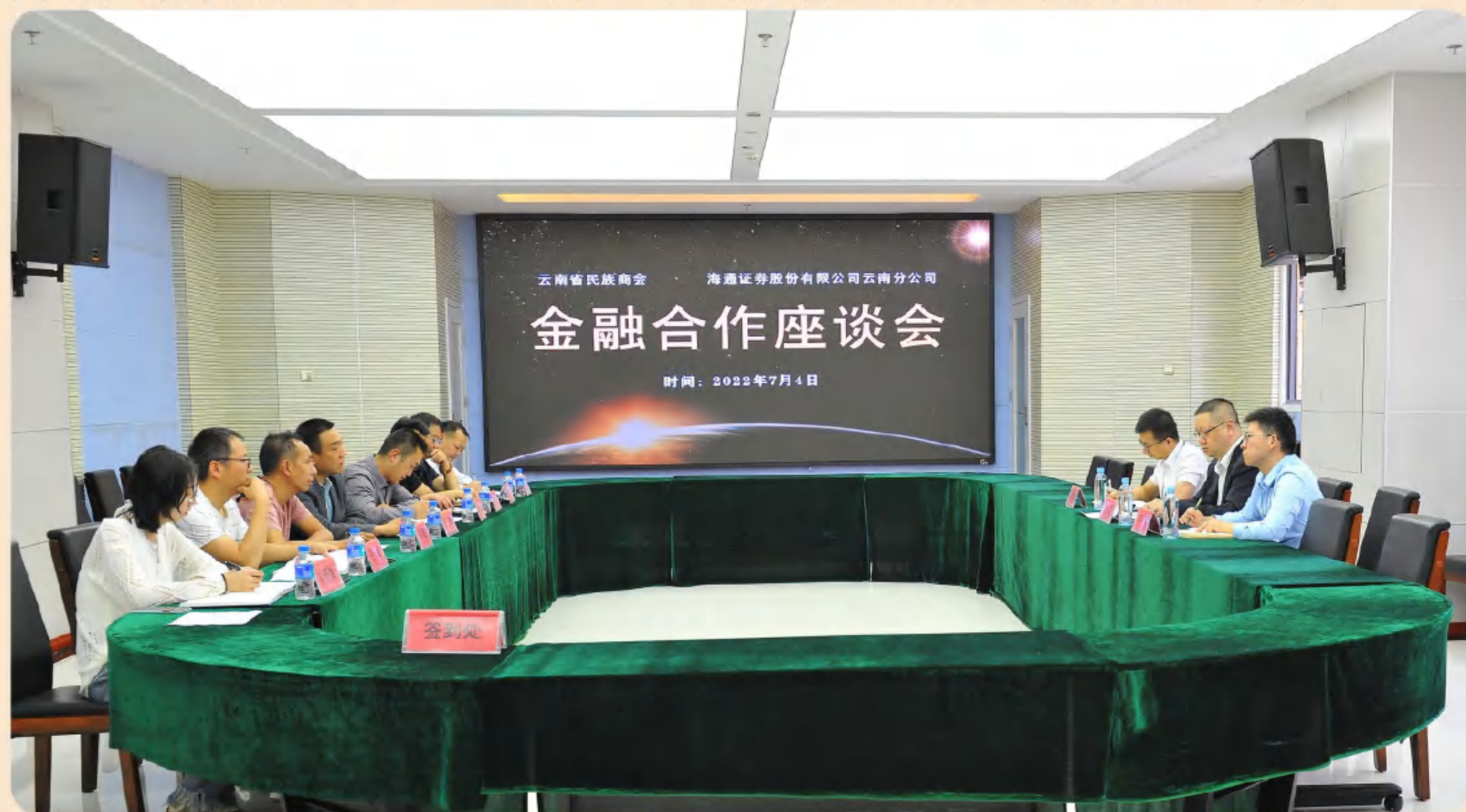
云南省民族商会简报 2022 年（第二十二期）1/2

王耀在介绍商会金融中心情况时说，为解决会员企业在发展过程中遇到的各种难题，在深入了解企业投资融资诉求，倾听企业意见和建议后，商会金融中心做了大量工作，先后与多家银行进行了合作洽谈，制定了专门的金融配套匹配服务，同时与多家投融资机构建立联系，多管齐下加大对企业的支持力度。今年，云南省民族商会计划与多家银行及金融融资机构开展合作，扩大投资融资服务圈，并把“寻找最具投资价值企业”的商业路演活动在全省范围内推广开来。